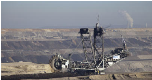
Erkelenz, Tagebau Garzweiler