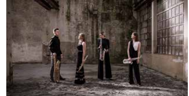
Eternum Saxophonquartett

13 und 15 Uhr: Führungen durch die Abtei Brauweiler und durch die romanische Kirche St. Nikolaus und St. Medardus Führungen auch für Kinder! Team der Abtei- und Kirchenführer (VfG)