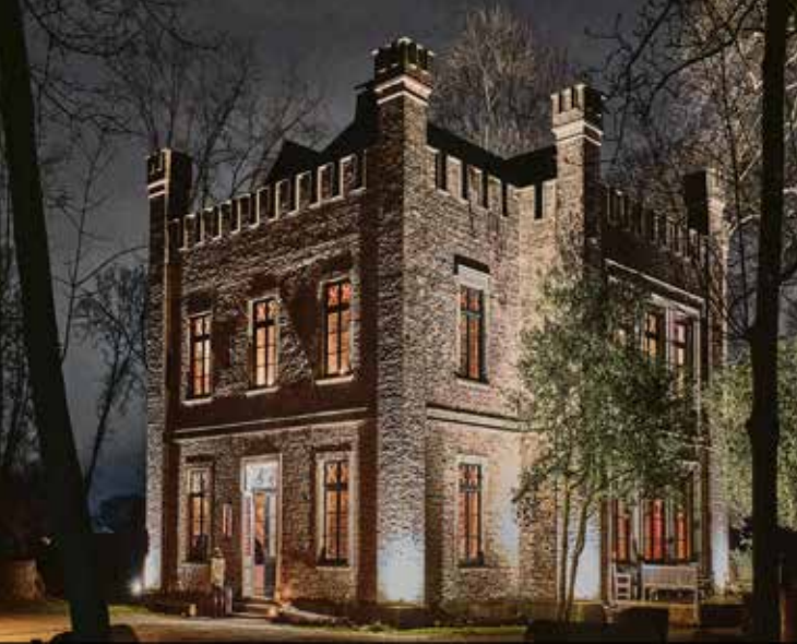
Das ehemalige Rittergut Orr