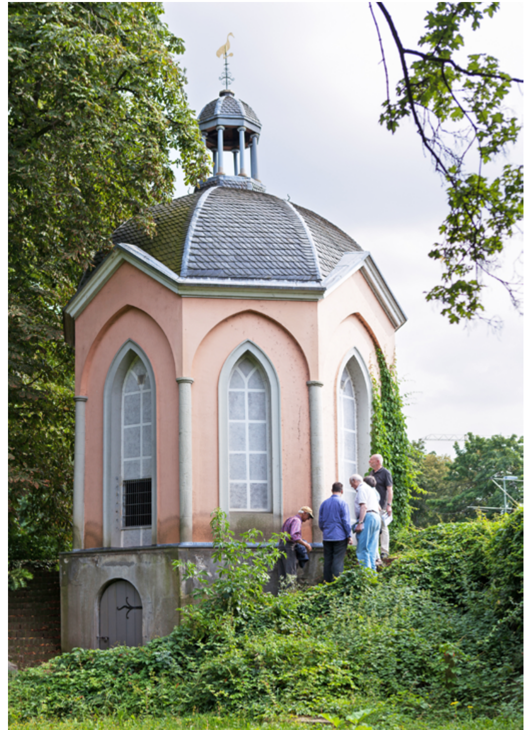
Seite gegenüber: 4. Meerbusch, Haus Meer. Der Gartenpavillon, auch „Teepavillon“, meistens aber „Teehäuschen“ genannt. Es wurde zwischen 1850 und 1865 in der südwestlichen Ecke des Parks auf der Immunitätsmauer des Klosters erbaut.

Nach zehn Jahren erfolgreicher Tätigkeit im Ehrenamt geht die