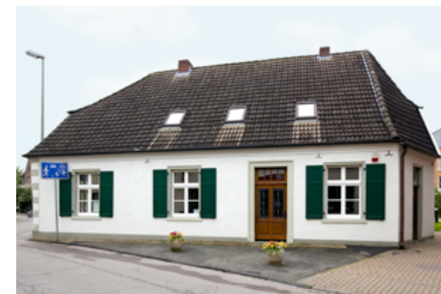
2. Hamminkeln-Dingden, Humberghaus. Foto: Silvia-Margrit Wolf, LVR-ADR, 2010.

Nach der Entmüllung des Umfeldes nahmen ehrenamtliche Helfer das Gebäude selbst in Angriff. Die ersten Eindrücke waren erschreckend – geradezu entmutigend. Schnell wurde erkannt, dass Fragen der Machbarkeit und konkrete Planungen zurückgestellt werden mussten, bis das Haus von Efeu, Müll, nachträglich eingezogenen Wänden und abgehängten Decken befreit war. Nicht vermutete Schäden wurden sichtbar, deren Tragweite nur von Fachleuten beurteilt werden konnte. Ein beauftragter Architekt sah nach einer ersten Begehung einen Sanierungsbedarf von etwa 100.000 Euro. Von Handwerksbetrieben und Sponsoren erhoffte sich der Heimatverein Un-