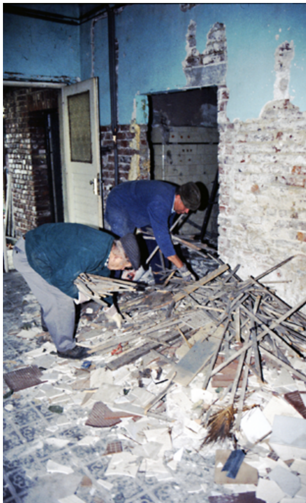
3. Dingden, Humberghaus. Abfall im Erdgeschoss, 2001.

terstützung. Der Vorsitzende stellte ambitioniert fest: „Was geht, bauen wir in Eigenleistung.“