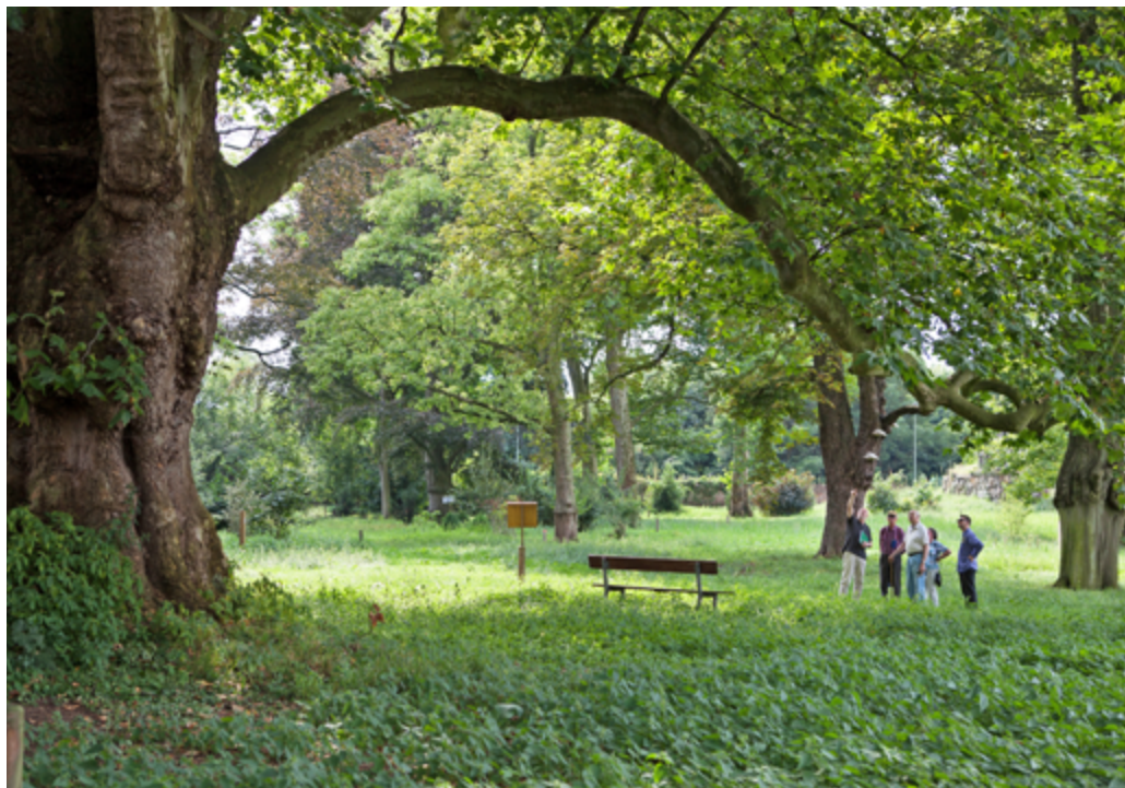
1. Meerbusch, Landschaftspark Haus Meer, entworfen vom Königlichen Garteninspektor Joseph Clemens Weyhe, 1865.