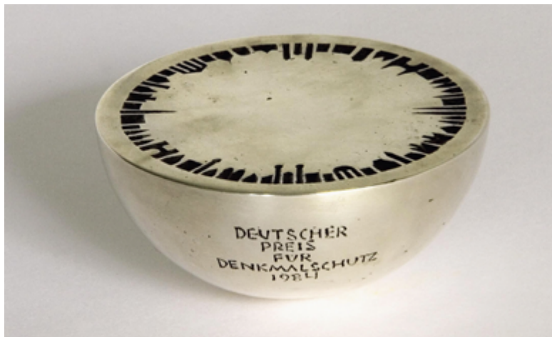
1. Die „Silberne Halbkugel“, entworfen von Professor Fritz Koenig, Landshut, wird seit 1979 jährlich vom Deutschen Nationalkomitee für Denkmalschutz verliehen.

Das Vorhalten von Informationsschriften für die Bürger ist eines der wichtigen und bewährten Instrumente des DNK. Wir haben in den vergangenen 40 Jahren eine Reihe von Publikationen zu verschiedenen, aktuellen und brisanten Themenfeldern der Denkmalpflege erarbeitet und veröffentlicht, viele auch in wiederholter Auflage. Die DNK-Schriftenreihe zählt inzwischen 82 Bände. Daneben haben wir 22 Faltblätter herausgegeben, die kurz und präzise, aber allgemein verständlich geschrieben auf jeweils 8 Seiten wichtige Themen der Denkmalpflege wie Unterwasserarchäologie, Bauforschung, Nachkriegsmoderne erklären. Sie werden wie die Bände der Schriftenreihe kostenlos abgegeben, damit wir eine möglichst große Verbreitung erreichen. Man kann über ein Bestellformular auf der Homepage des DNK www.dnk.de ganz einfach online auch mehrere Publikationen gleichzeitig bestellen. Wir beobachten, dass unsere Schriften sehr gut nachgefragt werden, von Bürgern, von Besuchern der Denk-