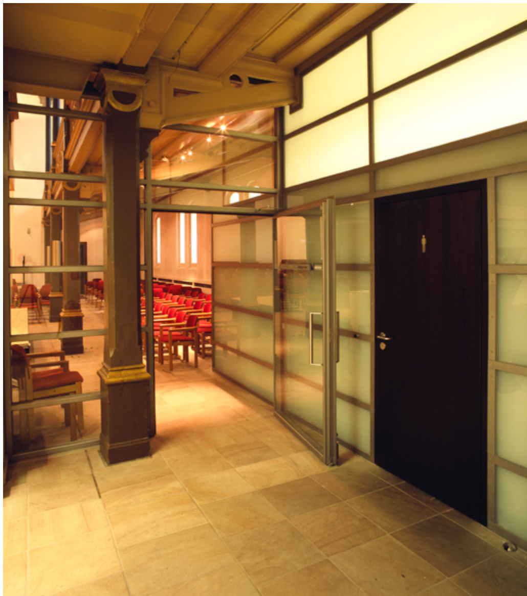
4. Der Innenraum der Immanuelkirche nach Abschluss der Modernisierungsmaßnahmen. Durchgang vom Foyer zum Konzertsaal. Foto: Jürgen Gregori, LVR-ADR, 2007.