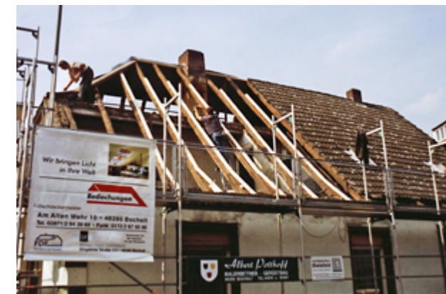
4. Dingden, Humberghaus. Neue Bedachung, 2003.