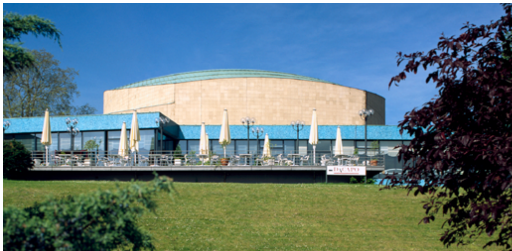
2. Bonn, Beethovenhalle. 2010 wurde die Initiative Beethovenhalle des Kunsthistorischen Instituts der Universität Bonn mit der „Silbernen Halbkugel“ ausgezeichnet.

gang mit Kirchengebäuden. Unsere aktuellen letzten Veranstaltungen behandelten das Thema Barrierefreiheit und Denkmalschutz Anfang Juli in Leipzig 16 und „Städte pflegen Denkmal planen“ im September in Flensburg 17 ; im Oktober findet ein Expertengespräch über „Integration und Erbe“ in Berlin statt.