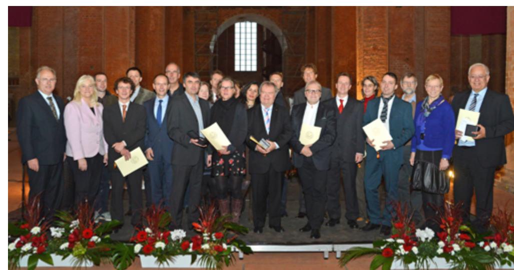
3. Die Preisträger und Preisträgerinnen des Deutschen Preises für Denkmalschutz in Wismar, 2012.

die Ausschreibung eines besonderen Internetpreises geschehen, mit dem herausragende Beiträge ausgezeichnet werden, die ausschließlich im Internet veröffentlicht worden sind und demonstrieren, wie das Internet für aktuelle Formen des Online-Journalismus oder der Informationsvermittlung in sozialen Netzwerken mit vertiefenden Analysen, aber auch konstruktiver Kritik und relevanten Service-Leistungen eingesetzt werden kann. An dieser Stelle möchte ich auch den DNK-Studentenworkshop nennen. In diesem Jahr haben wir ihn zum achten Mal ausgerichtet, diesmal in Bochum-Langendreer. Betreut wird der Studentenworkshop durch die LWL-Denkmalpflege, Landschafts- und Baukultur in Westfalen und die Fachhochschule Dortmund mit Unterstützung der Stadt Bochum. Bewerben können sich Studierende, die Interesse an Fragen der Denkmalpflege haben und eine Woche in betreuten Kleingruppen interdisziplinär und praxisbezogen arbeiten