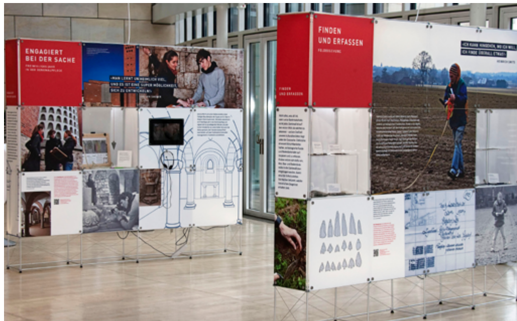
3. Blick auf einen Teil der Ausstellung „Unser Denkmal. Wir machen mit“, Landtag Düsseldorf.

Mal so hoch, wie man es gemeinsam für die Kultur angibt. Bei der Kulturförderung, so die Experten für Kulturinvestitionen, setzt ein in die Kultur investierter Euro rund 3 Euro um.